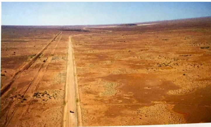
Photographie aérienne du bush australien

Consigne : observez et analysez les documents suivants, puis complétez le tableau.