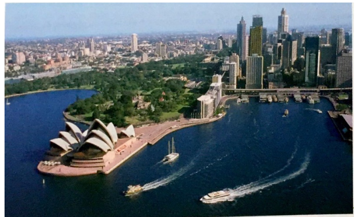
Photographie de la ville de Sydney (Australie)